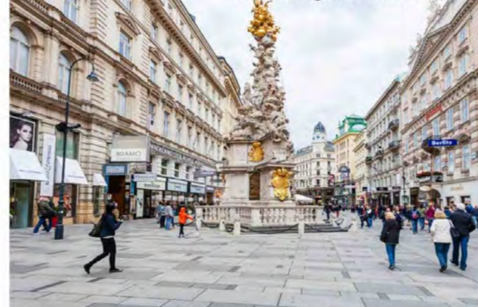
Entfernung zum Zentrum 6,4 km