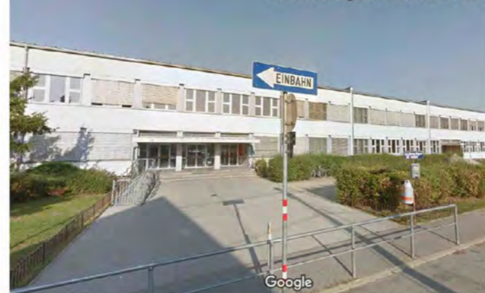
Entfernung zur Schule 270 m