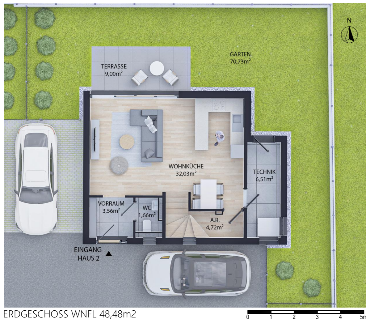
ERDGESCHOSS WNFL 48,48m 2