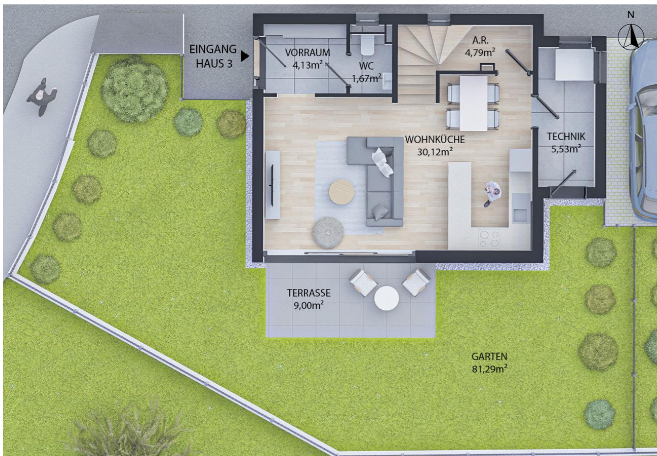
ERDGESCHOSS WNFL 46,24m 2