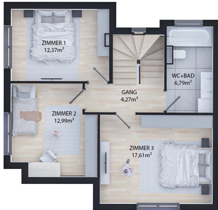
OBERGESCHOSS WNFL 54,03m 2