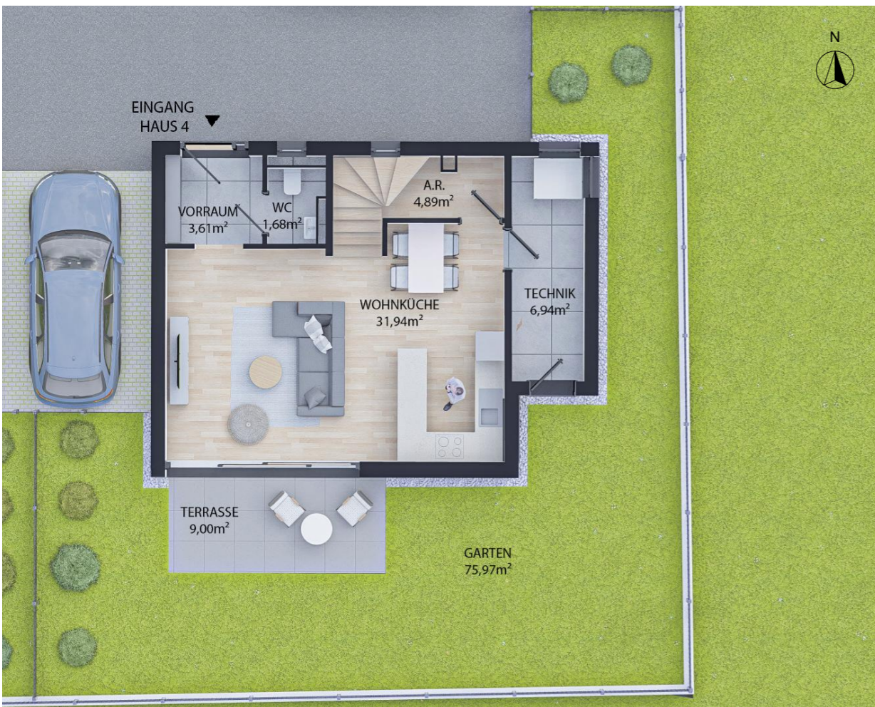
ERDGESCHOSS WNFL 49,06m 2